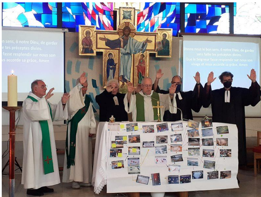
Nice, septembre 2021 Célébration œcuménique à l'issue d'une Fresque du climat