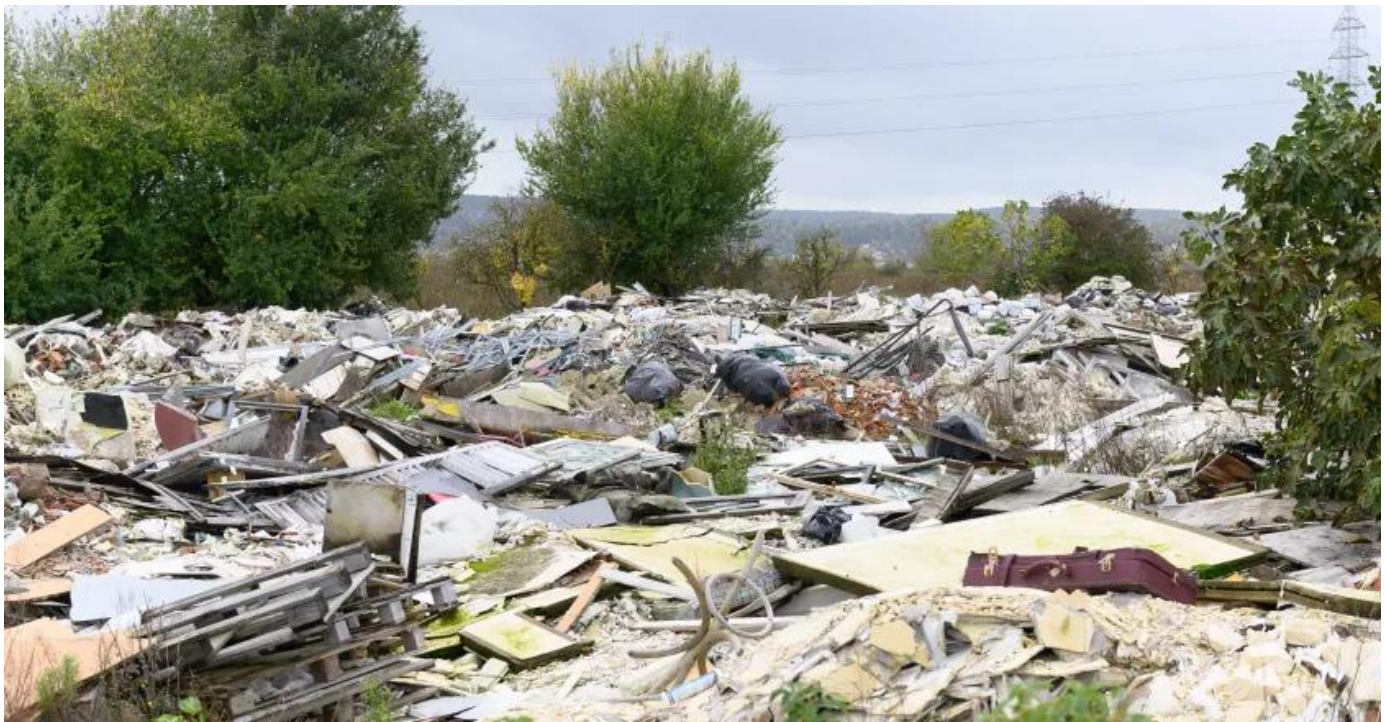
Déchèterie sauvage à Carrières-sous-Poissy en Ile-de-France

117. [...] Quand on ne reconnaît pas, dans la réalité même, la valeur d'un pauvre, d'un embryon humain, d'une personne vivant une situation de handicap – pour prendre seulement quelques exemples – on écoutera difficilement les cris de la nature elle-même. Tout est lié. Si l'être humain se déclare autonome par rapport à la réalité et qu'il se pose en dominateur absolu, la base même de son existence s'écroule, parce qu'« au lieu de remplir son rôle de collaborateur de Dieu dans l'œuvre de la création, l'homme se substitue à Dieu et ainsi finit par provoquer la révolte de la nature ».[95]