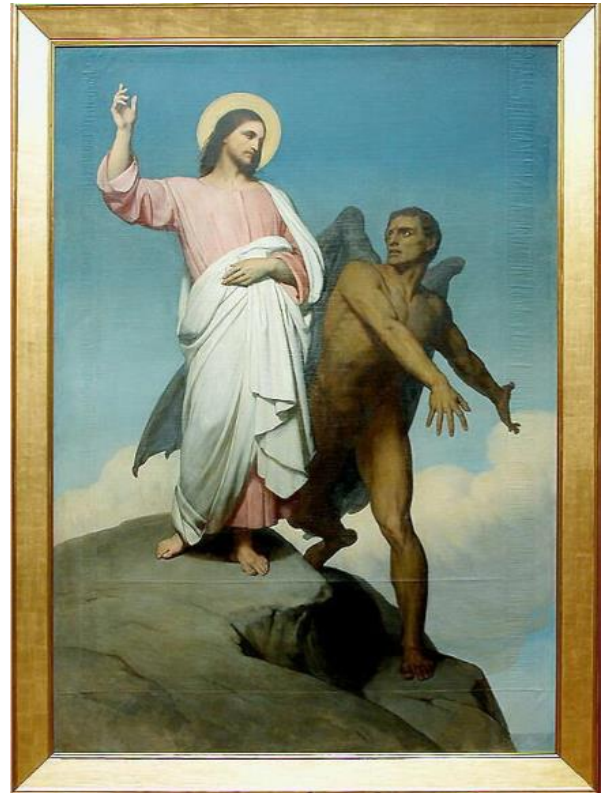
La tentation du Christ, Collection du Louvres 1850 / 1875 (3e quart du XIXe siècle) Scheffer Ary

Souvenons-nous de l'appel de Saint François d'Assise. « Pourquoi sers-tu le serviteur et non le maître ? ». Menons une introspection, laissons nos guerres de toute sorte et convertissons-nous. Saint François d'Assise a trouvé la réponse à ce qu'il cherchait : passer sa vie à aimer la Création. Et si nous, nous y passions au moins notre Carême ?