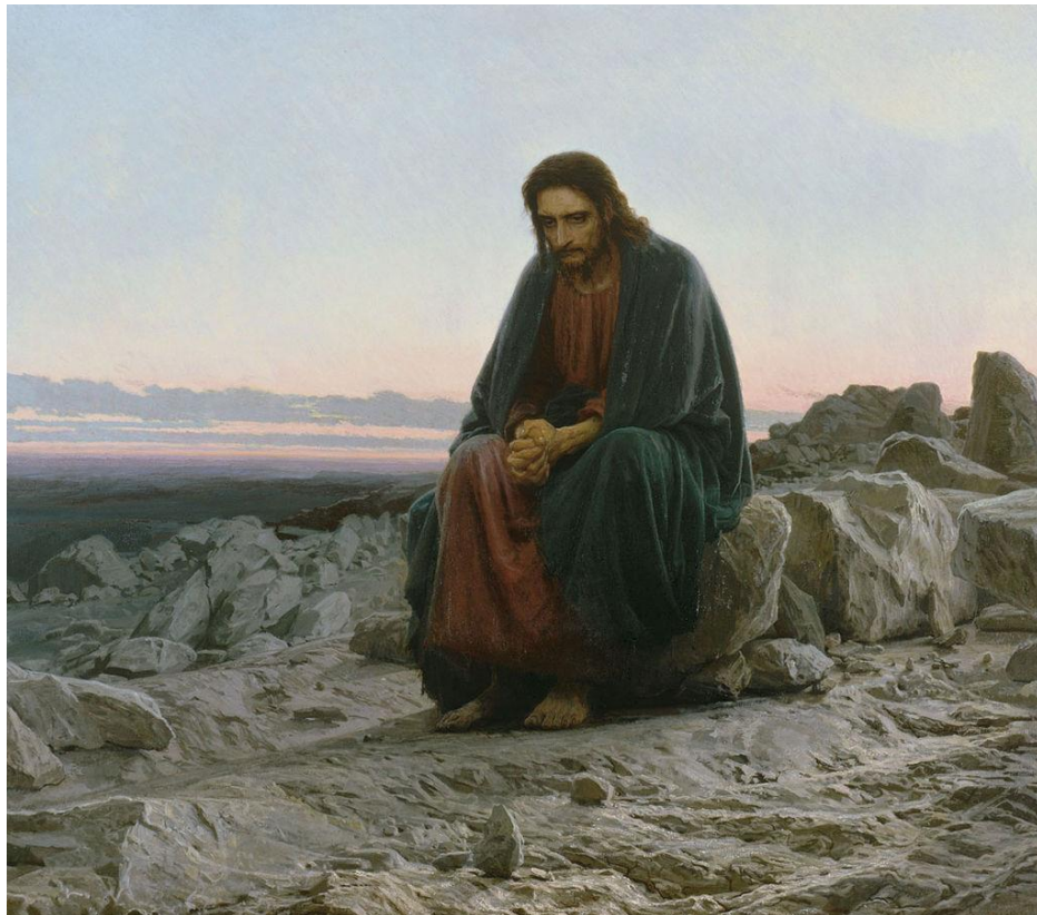
Jésus dans le désert par Ivan Kramskoi (1872)

220. Cette conversion suppose diverses attitudes qui se conjuguent pour promouvoir une protection généreuse et pleine de tendresse. En premier lieu, elle implique gratitude et gratuité, c'est-à-dire une reconnaissance du monde comme don reçu de l'amour du Père, ce qui a pour conséquence des attitudes gratuites de renoncement et des attitudes généreuses même si personne ne les voit ou ne les reconnaît : « Que ta main gauche ignore ce que fait ta main droite [...] et ton Père qui voit dans le secret, te le rendra » (Mt 6, 3-4). Cette conversion implique aussi la conscience amoureuse de ne pas être déconnecté des autres créatures, de former avec les autres êtres de l'univers une belle communion universelle. Pour le croyant, le monde ne se contemple pas de l'extérieur mais de l'intérieur, en reconnaissant les liens par lesquels le Père nous a unis à tous les êtres. En outre, en faisant croître les capacités spécifiques que Dieu lui a données, la conversion écologique conduit le croyant à développer sa créativité et son enthousiasme, pour affronter les drames du monde en s'offrant à Dieu « comme un sacrifice vivant, saint et agréable » (Rm 12, 1). Il ne comprend pas sa supériorité comme motif de gloire personnelle ou de domination irresponsable, mais comme une capacité différente, lui imposant à son tour une grave responsabilité qui naît de sa foi.