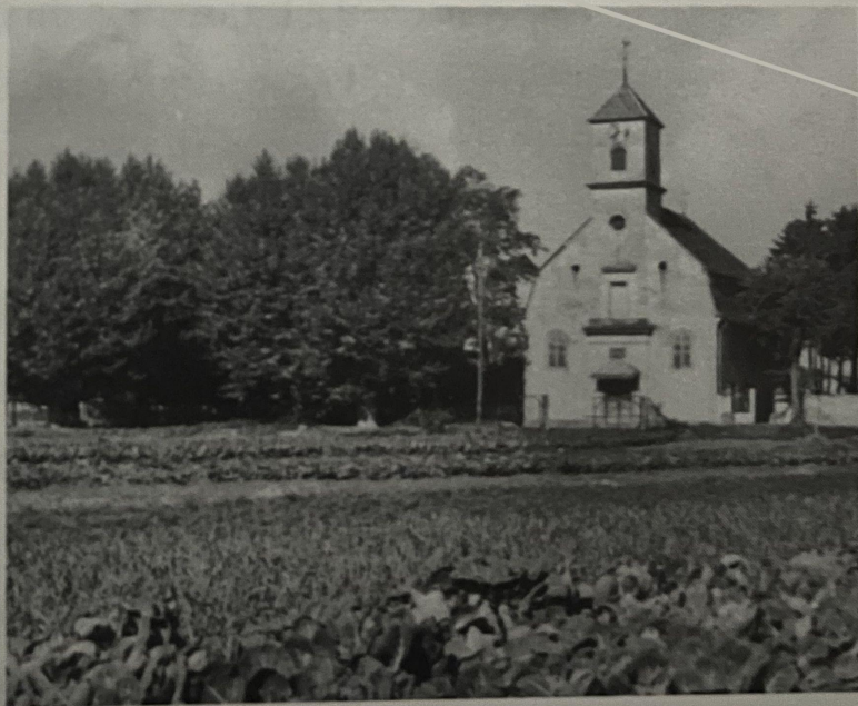
■ Eglise protestante de Graffenstaden dans les années 40.