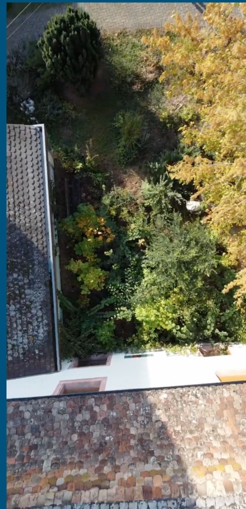
Pépinière 2022 vs 2024